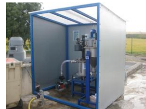
Planta piloto en EDAR Los Arcos pruebas industriales