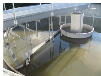
EDAR Los Arcos

Definición de los requerimientos a cumplir por la planta demostrativa, estudio de los distintos tipos de aguas a tratar (aguas residuales EDAR, aguas residuales industrias petroquímicas, aguas residuales industrias alimentarias), recogida de aguas de los diferentes puntos seleccionados y su caracterización en base a unos parámetros seleccionados.