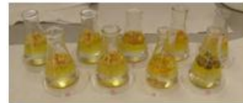
Material absorbente con agua contaminada

Los requerimientos del sistema de biodegradación se basaron en el estudio de contaminantes aceitosos en aguas residuales y en los posibles microorganismos degradadores de estas aguas residuales aceitosas.