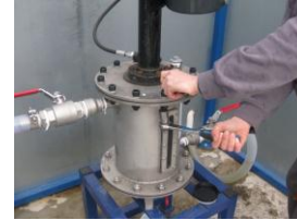
Pruebas planta piloto