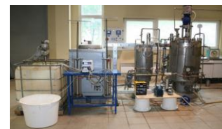
Planta piloto en Biocentras pruebas

Se han definido aplicaciones para los residuos finales obtenidos.